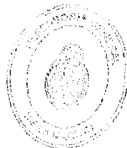
DEFENSOR GENERAL DE LA NACIÓN